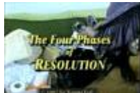
The Four Phases of Resolution